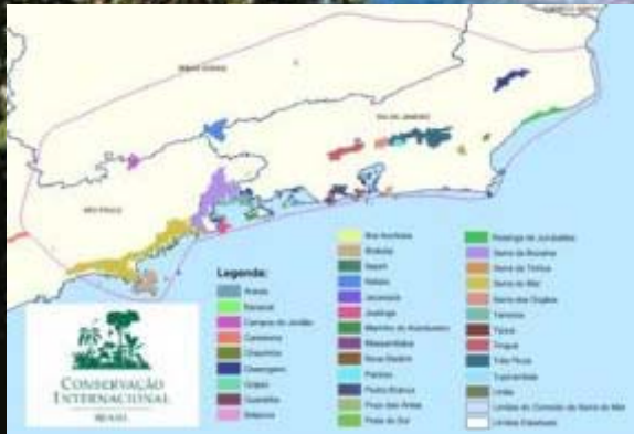
Corredor Serra do Mar