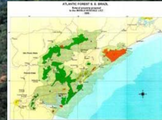
Sítio do Patrimônio Mundial