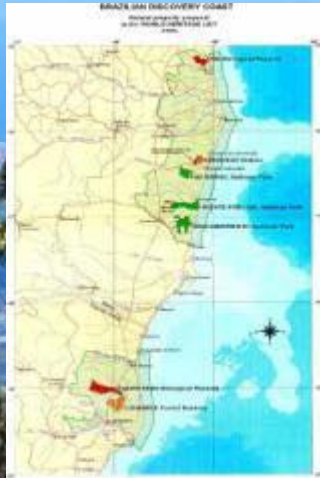
Corredor Central Mata Atlântica