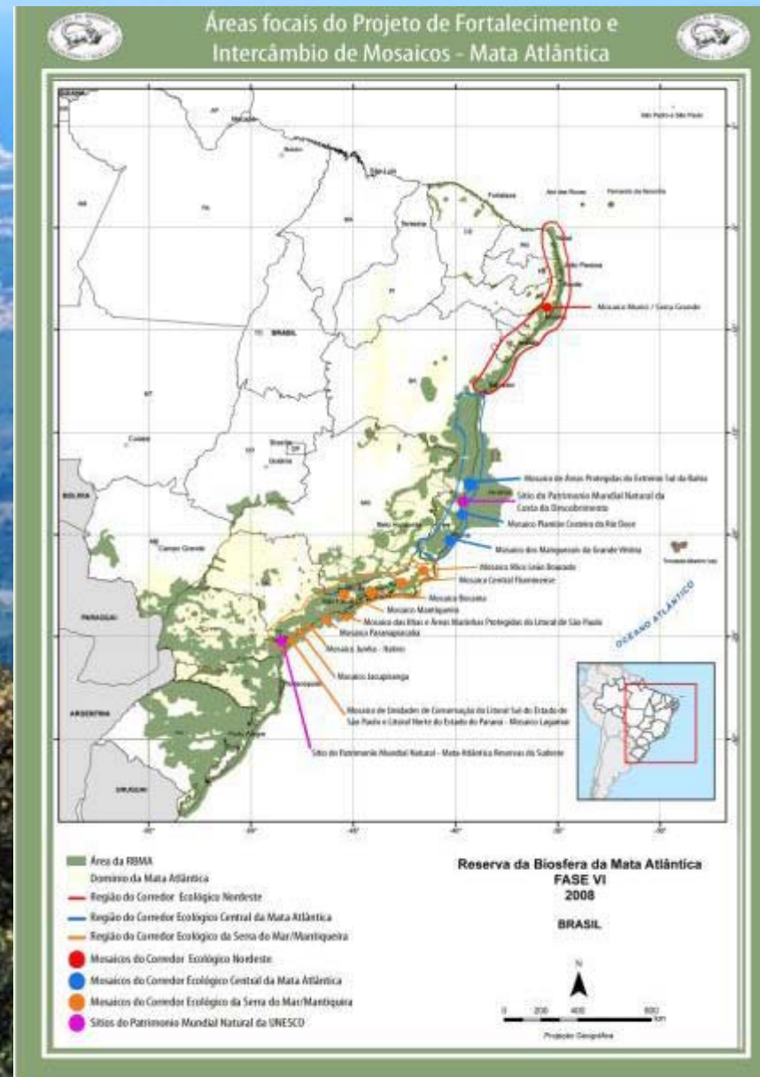
Figura 1 – Mapa Geral das Áreas Focais do Projeto de Fortalecimento e Intercâmbio de Mosaicos.