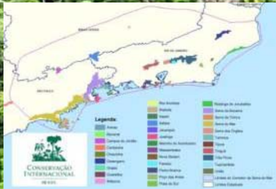
Corredor Serra do Mar