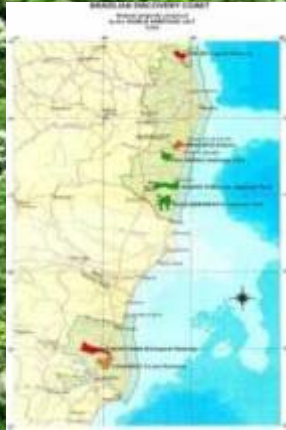
Corredor Central Mata Atlântica