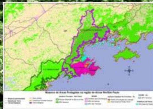
Mosaicos de UCs