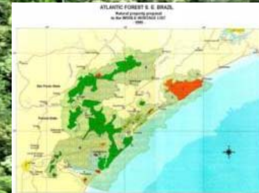
Sítio do Patrimônio Mundial