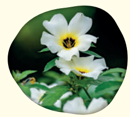
Turnera subulata (Sm.) - Chanana