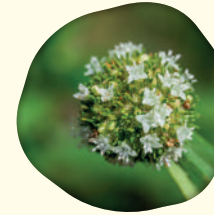
Borreria verticillata (L.) - Vassoutinha de botão

Exemplos de algumas espécies vegetais visitadas por abelhas em fragmento de Mata Atlântica do Território Litoral Norte e Agreste Baiano podem ser vistas adiante: