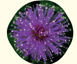
Mimosa pudica (L.) - Dormideira