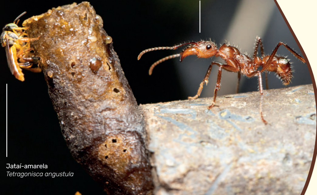
Jataí-amarela Tetragonisca angustula