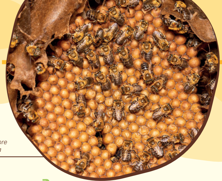
Operárias sobre discos de cria

As operárias fazem quase todo o trabalho da colônia: de alimentar as larvas; ventilar a colmeia batendo as asas quando está quente; produzir calor quando está frio; produzir a cera; construir os favos; cuidar da rainha; guardar a colmeia contra os inimigos; coletar o néctar, o pólen e o própolis; elaborar o mel; etc.