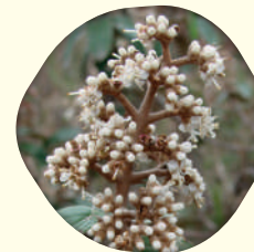
Miconia albicans - Canela-de-velho