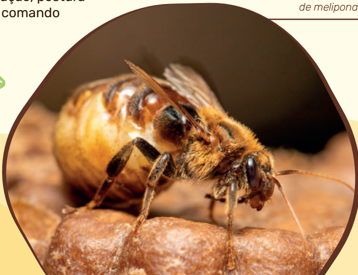
Abelha rainha de melipona

A abelha rainha é responsável pela reprodução, postura dos ovos, e comando da colmeia.