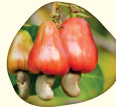
Anacardium occidentale (L.) - Cajueiro