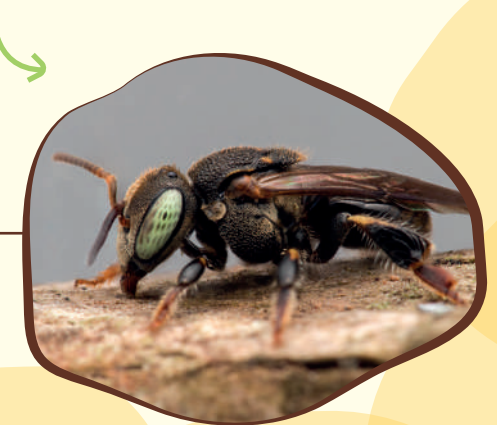
Zangão de Centris sp.

Os zangões são os machos da colônia, cuja única função é a de cruzar com "rainhas" virgens.