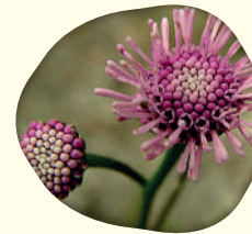
Conocliniopsis prasiifolia (DC.) - Mentraço