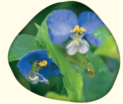
Commelina erecta - Olho-de-santa-luzia