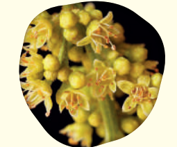
Tapirira guianensis (Aubl.) - Pau-pombo